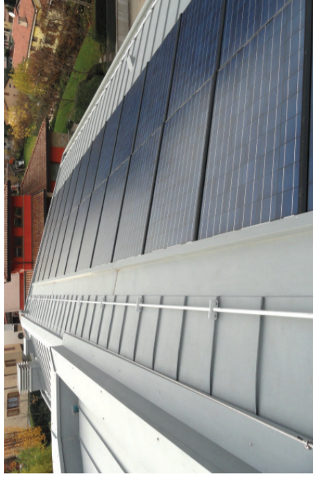
PANNELLI FOTOVOLTAICI INTEGRATI NELLA COPERTURA