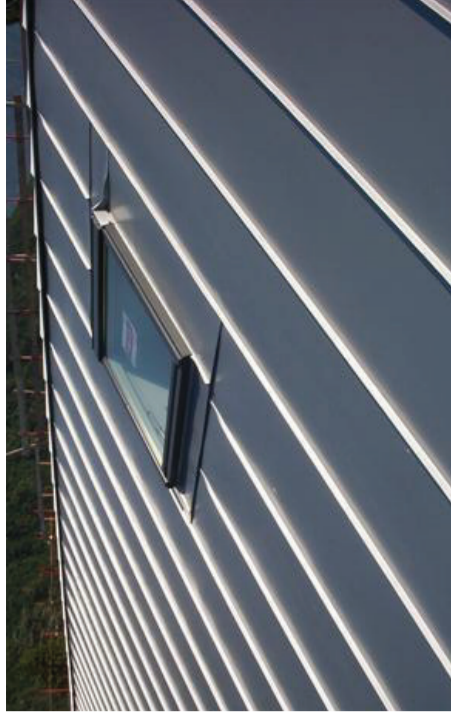
LUCERNARI APRIBILI INTEGRATI NELLA COPERTURA